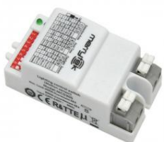
Sensor Movimento Merrytek MC061V