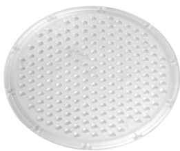
Lente p/ Campânula 90°