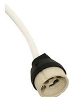
Suporte Gu10 class II